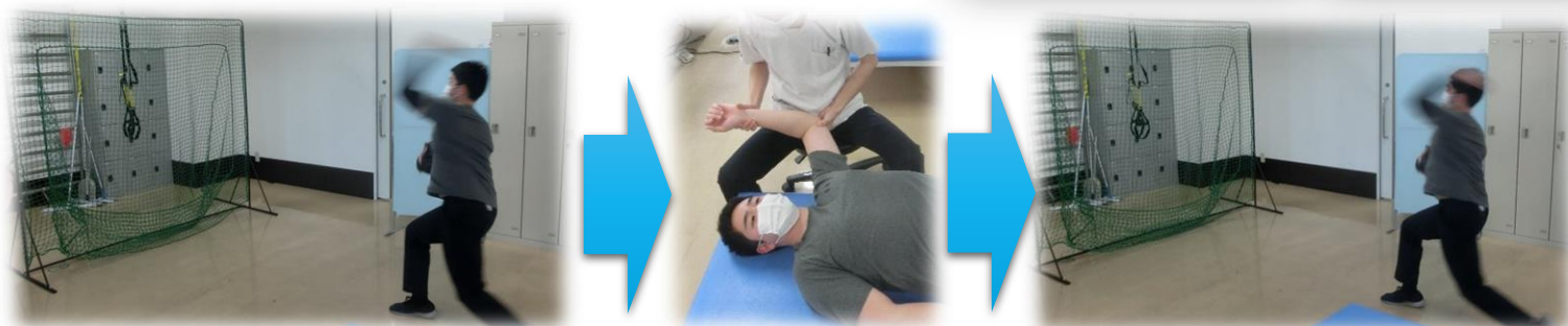
リハビリ前の測定